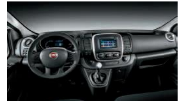
Kod unutrašnjosti 009 (Opc. 8L0)