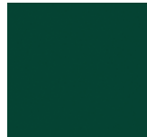
Zelena - Kod 390 (Opc. 4SA)