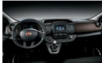
Kod unutrašnjosti 098 (Opc. 8L1)