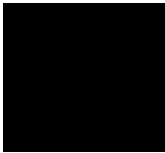
Crna - Kod 347 (Opc. 4H5)