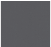
Tamno siva - Kod 360 (Opc. 74G)