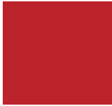
Crvena - Kod 442 (Opc. 802)