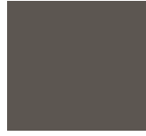
Specijalna siva - Kod 404 (Opc. 7AZ)